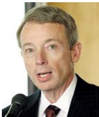
צ'רלס דיוולסון, נשיא נובל אנרג'י

עם כל הכבוד, מדוע אתה חושב שעמדתך ועמדת המכון גוברת על טענות יתר הגופים שנגשו לשימוע וטוענים כי שיעור היצוא נמוך מדי?